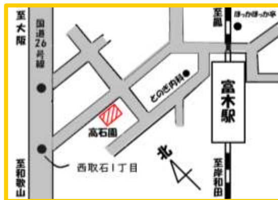
JR阪和線 富木駅より徒歩2分