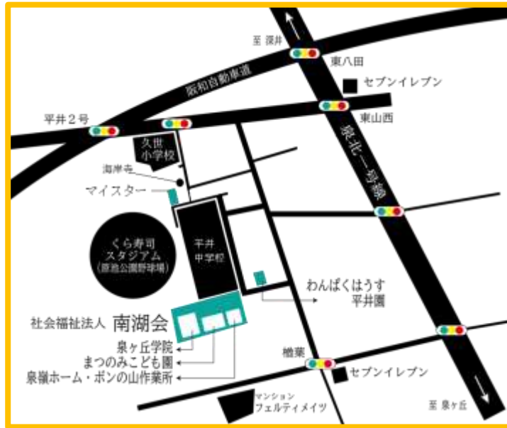
南海バス 久世小学校前下車 徒歩5分程度